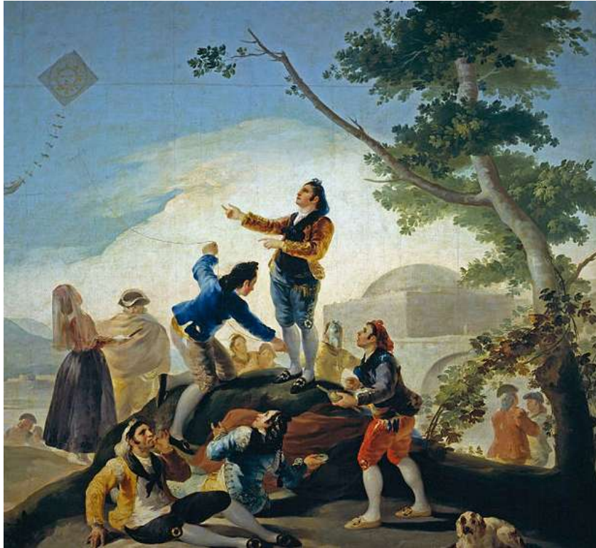
La cometa (1778). Autor: Francisco de Goya

Per acabar vos deixem el següent enllaç on podreu descobrir altres curiositats informacions: