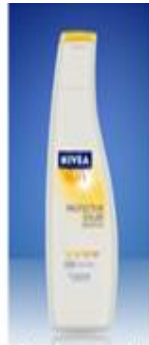
el protector solar