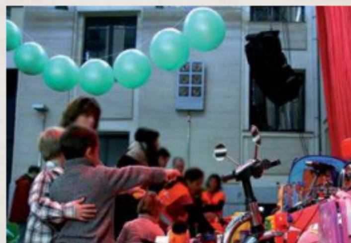
Sile Nole, el mercadillo de juguetes de La Casa Encendida.

http://ccaa.elpais.com/ccaa/2014/12/02/madrid/1417546978_129226.html (adaptación)