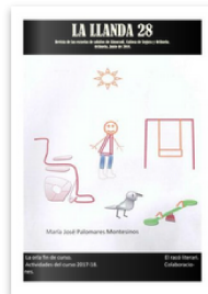
La Llanda 28 ilovepdf compressed by Escuela de Adultos de Orihuela. Published 2 years ago 60 pages