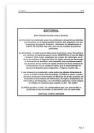
La Llanda nº 5 by Escuela de Adultos de Orihuela. Published 6 years ago 29 pages