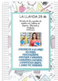
La Llanda 29 by Escuela de Adultos de Orihuela. Published 1 year ago 60 pages