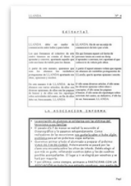
La Llanda Nº 4 by Escuela de Adultos de Orihuela. Published 6 years ago 32 pages