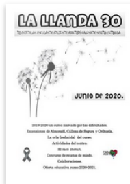
La Llanda 30. by Escuela de Adultos de Orihuela. Published 6 months ago 60 pages