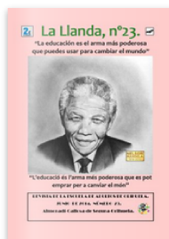
La Llanda nº 23 by Escuela de Adultos de Orihuela. Published 7 years ago 60 pages