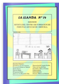
La Llanda nº 14 by Escuela de Adultos de Orihuela. Published 13 years ago 40 pages