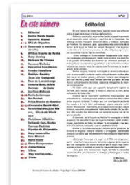
La Llanda nº 10. by Escuela de Adultos de Orihuela. Published 15 years ago 39 pages