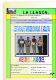
La Llanda nº17 by Escuela de Adultos de Orihuela. Published 12 years ago 48 pages