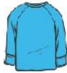
long sleeve t-shirt