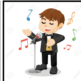
CANTANT( es diu igual en femení i en masculí)