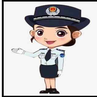
POLICIA ( es diu igual en femení i en masculí)