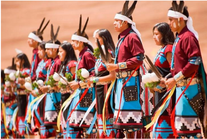
Espectáculo de los bailes indios en la plaza del pueblo en Gallup.

hacer un recorrido por su plaza central. Ahí podrás encontrar el mercado de artesanías india, y el hotel La Fonda con más de 200 años de antigüedad.