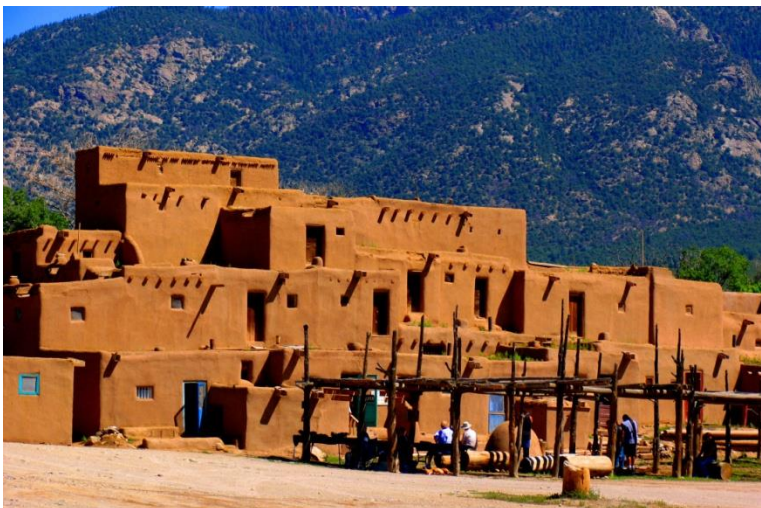
Pueblo de los Taos.

Tucumcari, que es el pueblo mas grande entre Amarillo y Albuquerque. Un pueblo digno de admirar de noche ya que sus luces de neón por todas sus construcciones y moteles de la zona te dejarán atónito. Pasar la noche aquí es una buena opción. En Tucumcari también encontrar buenas tiendas para comprar souvenirs, un ejemplo es la tienda Tee Pee.