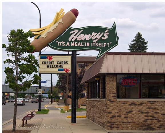
Parada para comer en el Henry's.

Otro de los lugares que no te puedes perder en Chicago es el Lou Mitchell, un clásico desde 1923. Miembro de la Route 66 hall of fame y famoso por inventar los donuts. Imprescindible para comenzar la jornada del día y llenarse de caloría para un día largo de ruta.