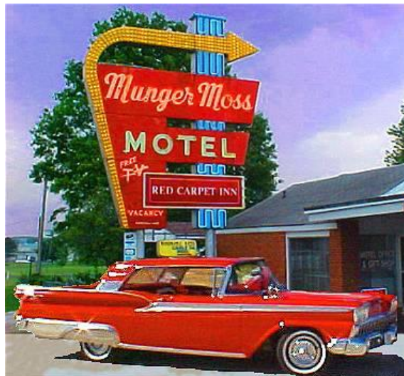
Munger Moss Motel

Dormir en un motel de carretera es una experiencia única. Prueba a dormir en el histórico Motel Munger Moss. Las habitaciones son auténticas, se ven anticuadas pero limpias. Indispensable echar partida de bolos en el bowling que hay enfrente del hotel.