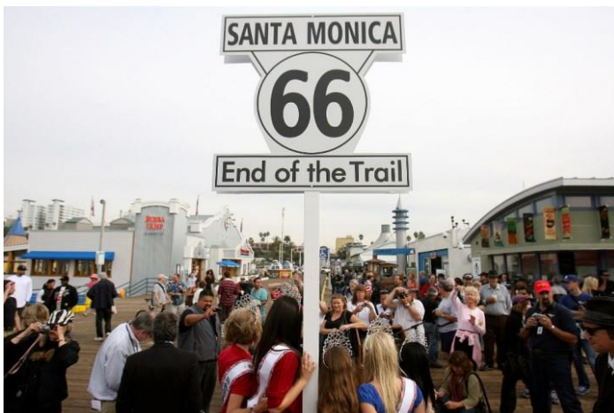
Cartel que nos avisa del fin del tramo.

Santa Mónica es el verdadero final de la Ruta 66. Aunque mucha gente piense que el final de La Ruta 66 es en Los Ángeles, sin embargo deberían de saber que esta carretera ha sido objeto de muchas mejoras y ha sufrido bastantes cambios y por eso han afectado a la longitud del recorrido, y uno de ellos fue el traslado del final de Los Ángeles a Santa Mónica.