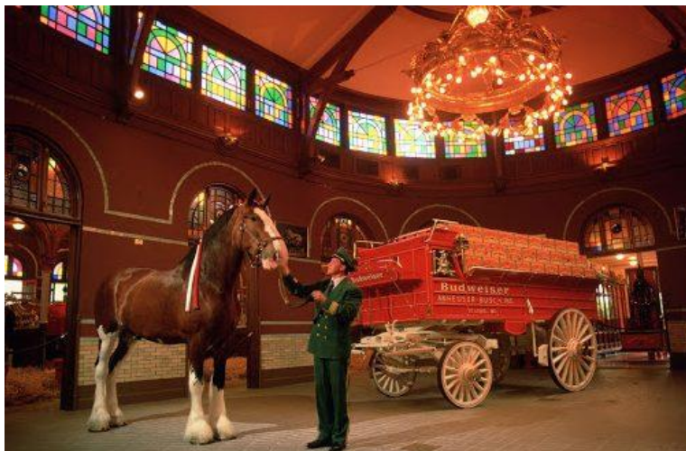
Fábrica de Cerveza en Misuri.

La Budweiser que casi todos conocemos se hace en Saint Louis. Budweiser es un tipo de cerveza que se originó en la ciudad checa de Pilsen. Es esta cerveza de Saint Louis la que se vende por todo el mundo. Así que, por respeto a los checos, la Budweiser estadounidense se vende simplemente como Bud en Europa. Aunque en Saint Louis sí que es verdad que abundan micro cervecerías que producen hasta una docena de cervezas distintas, y el probarlas todas sería difícil, te recomendamos que hagas un tour por la fábrica de cerveza.