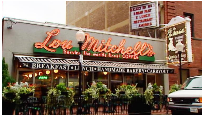
Desayuno en el Lou Mitchell's.

Otro de los lugares que no te puedes perder en Chicago es el Lou Mitchell, un clásico desde 1923. Miembro de la Route 66 hall of fame y famoso por inventar los donuts. Imprescindible para comenzar la jornada del día y llenarse de caloría para un día largo de ruta.