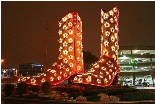
Monumento a las botas de Cowboy en North Star Mall.

Si eres un aficionado de la ropa cowboy en Amarillo podrás visitar tiendas de antigüedades y de ropa donde venden productos para locales: botas de cowboy, pantalones vaqueros, sombreros de cowboy y hasta los famosos cuernos para poner en el coche.