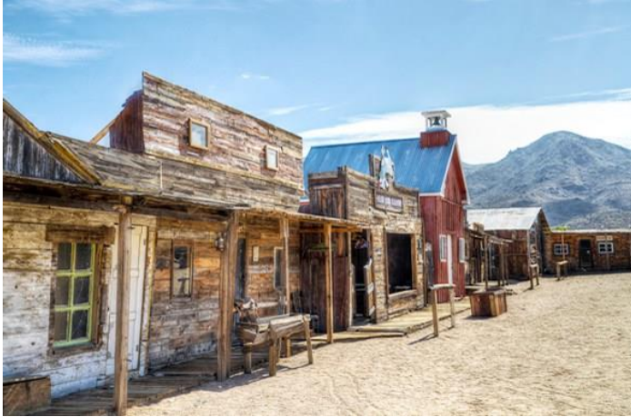
Chloride. Pueblo Fantasma.

Si quieres sentirte como un auténtico cowboy en el salvaje oeste mientras visitas alguno de los pueblos fantasma de la Ruta 66 , te recomendamos Chloride . Chloride es un pueblo de Arizona situado a media hora de Kingman en dirección a Las Vegas. Merece la pena hacer una pequeña parada.