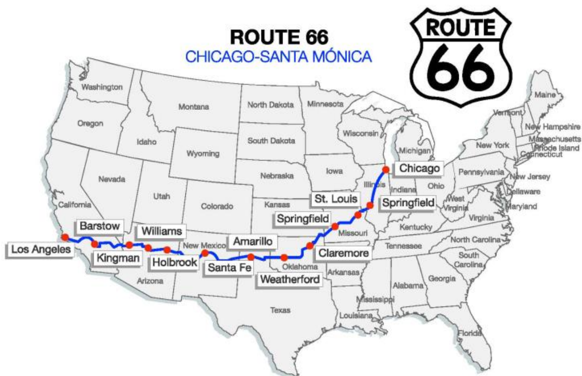
Mapa de la Ruta 66.