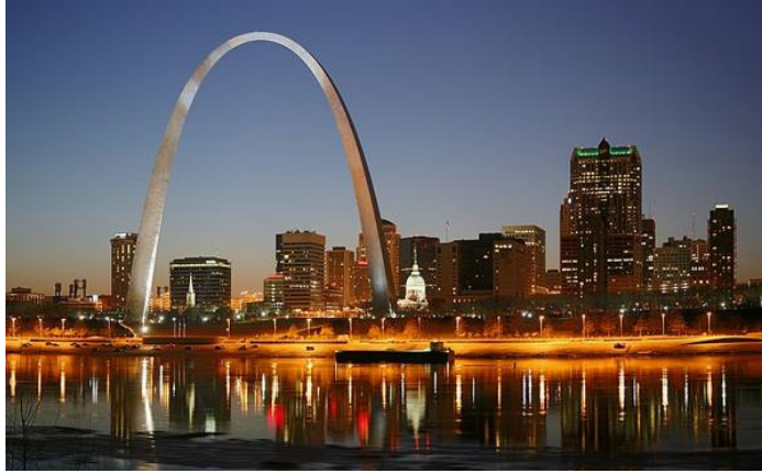
Vistas de la ciudad de St. Louis, Missouri, al anochecer

La Budweiser que casi todos conocemos se hace en Saint Louis. Budweiser es un tipo de cerveza que se originó en la ciudad checa de Pilsen. Es esta cerveza de Saint Louis la que se vende por todo el mundo. Así que, por respeto a los checos, la Budweiser estadounidense se vende simplemente como Bud en Europa. Aunque en Saint Louis sí que es verdad que abundan micro cervecerías que producen hasta una docena de cervezas distintas, y el probarlas todas sería difícil, te recomendamos que hagas un tour por la fábrica de cerveza.