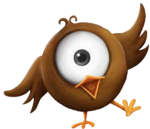
Serafín, el pájaro que buscaba su melodía

Disfruta de los otros cuentos de la colección y vive nuevas historias junto a: