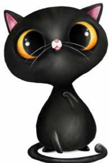
Gato Negro, el felino de la buena suerte