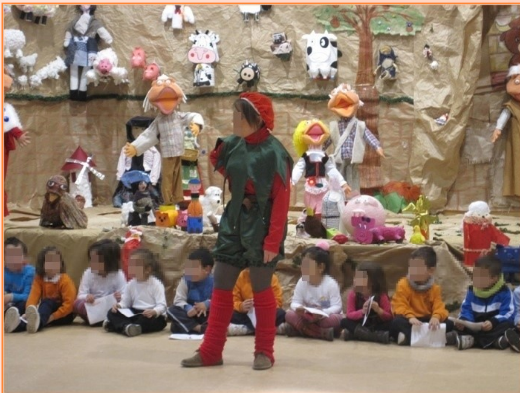
DUENDE DE LA NAVIDAD