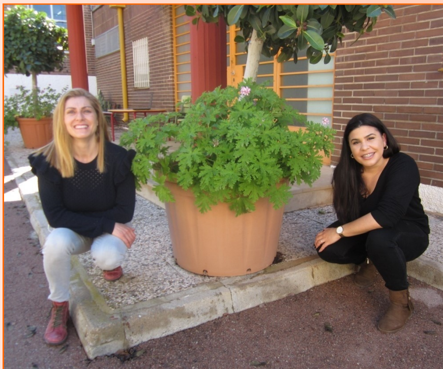
EQUIPO ORIENTACIÓN EDUCATIVA