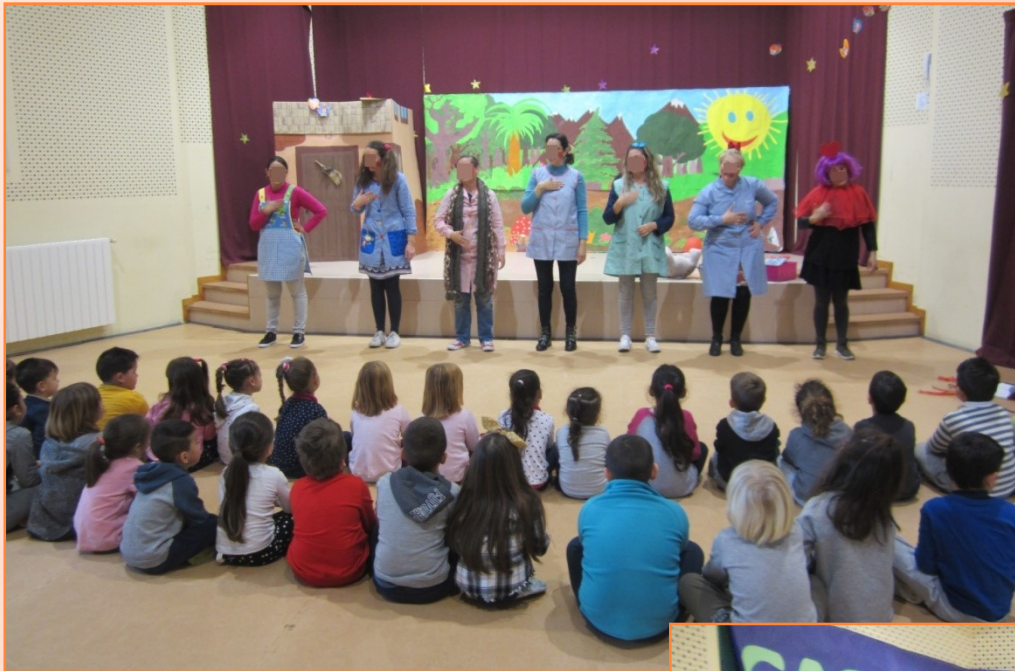
TEATRO "THE SCARF"