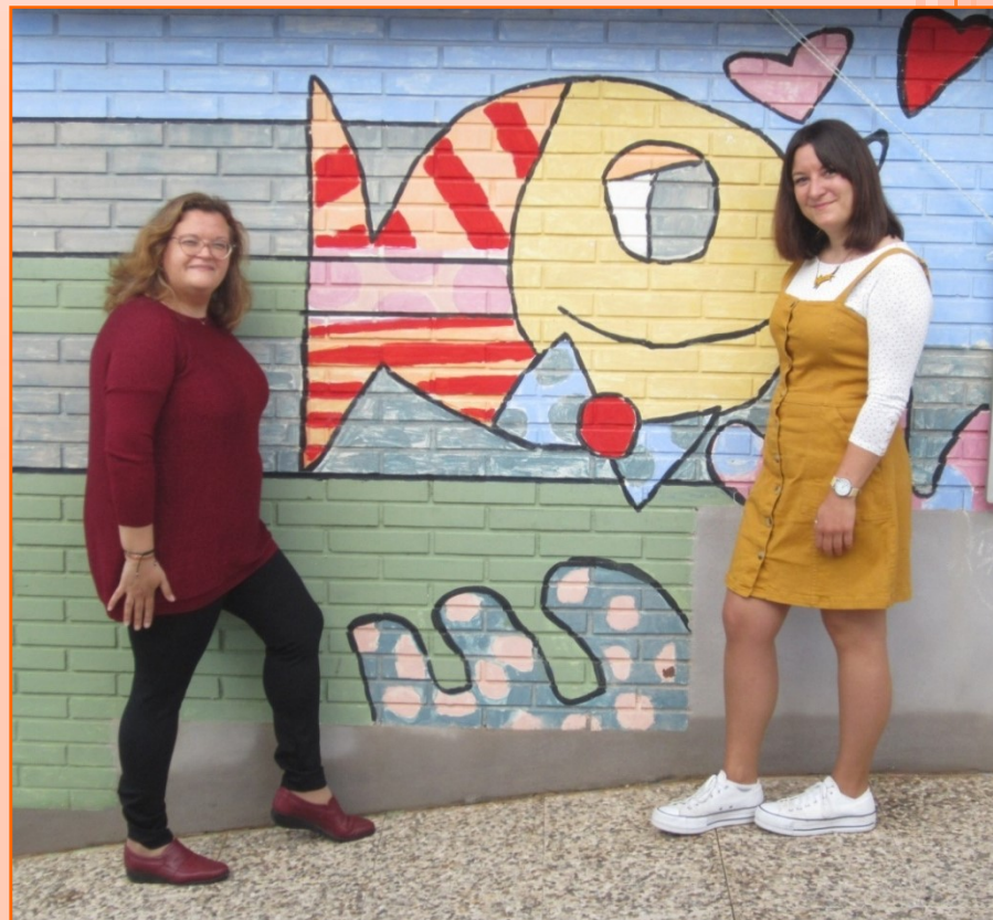
EQUIPO EDUCATIVO 4 AÑOS