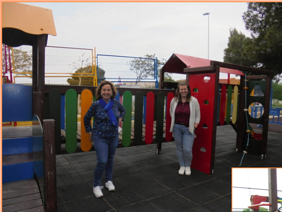
EQUIPO EDUCATIVO 4 Y 5 AÑOS