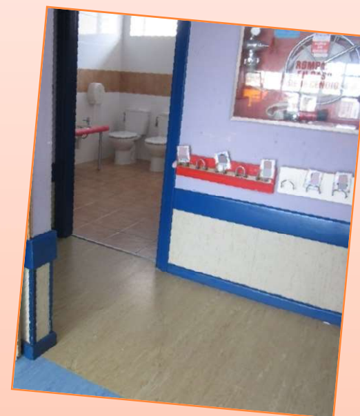
ACCESO DIRECTO AL BAÑO