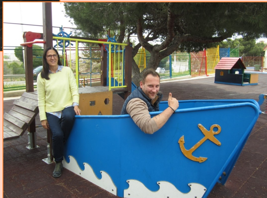
EQUIPO EDUCATIVO 5 AÑOS