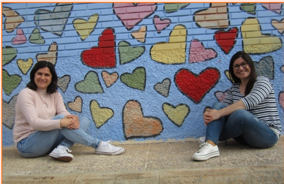
EQUIPO EDUCATIVO 3 AÑOS