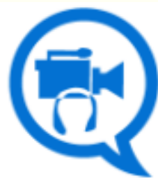
Imagen y Sonido