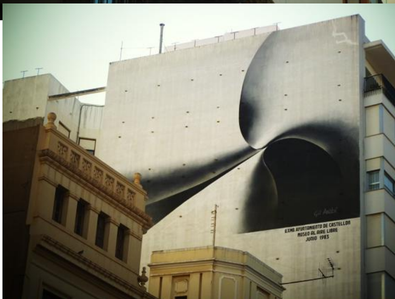
Paloma blanca, de Romualdo Gil Arabí.