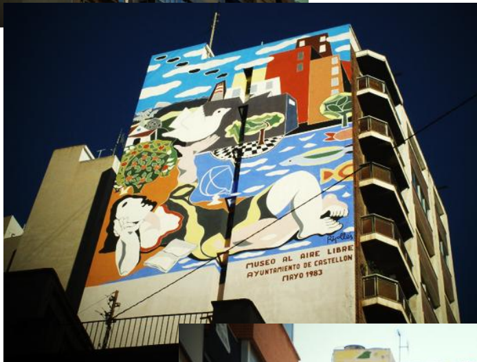
Transformación, de Ripollés