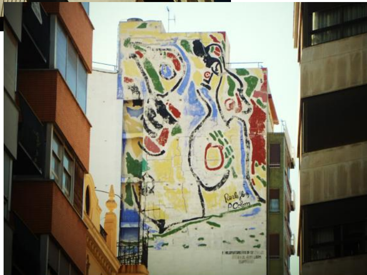
Sin título, de Perla Flors y Paco Colom