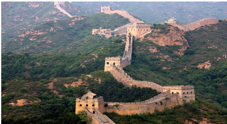
Gran Muralla China

Quants quilòmetres té la Gran Muralla China?