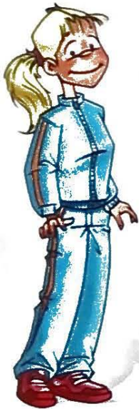
CATI, mestra d'Educació Física.