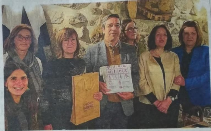
Participantes en el viaje realizado a tierras portuguesas.

Los profesores han visitado la Escuela Padre Himalaya situada en Sta. Maria de Távora para observar el funcionamiento de la biblioteca escolar «con el fin de recoger ideas y poder aplicarlas en nuestro proyecto de biblioteca so-