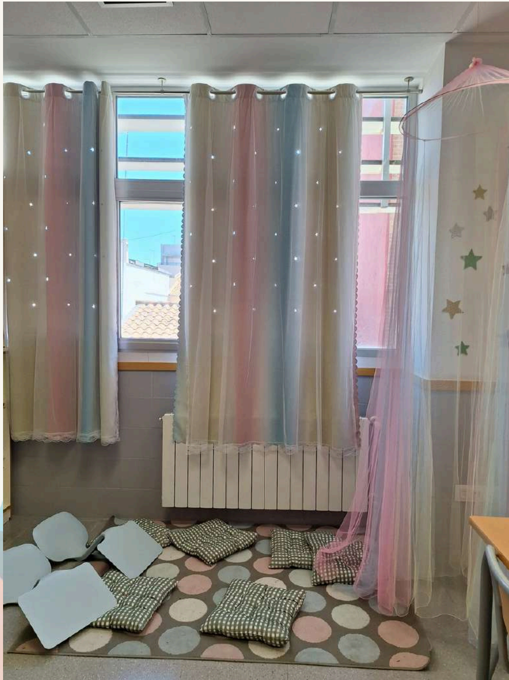
BIBLIOTECA DE CENTRE