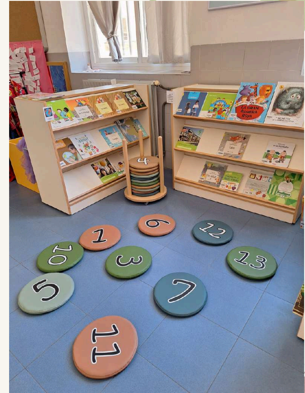
BIBLIOTECA EDUCACIÓ INFANTIL