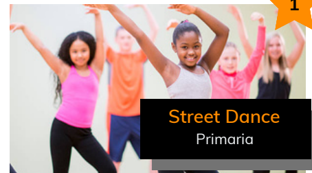
Street Dance Primaria

La actividad de streetdance para niños/as de primaria es una forma divertida y dinámica de introducir a los niños/as en el mundo de la danza urbana. Durante estas clases, los niños aprenden diversos estilos de streetdance, como hip-hop, locking y popping, mediante movimientos energéticos y creativos. Esta actividad no solo les permite expresar su creatividad a través de la danza, sino que también promueve la coordinación, el ritmo y la confianza en sí mismos. Además, al bailar en grupo, los niños desarrollan habilidades sociales y un sentido de pertenencia, todo mientras se divierten y mantienen un estilo de vida activo.