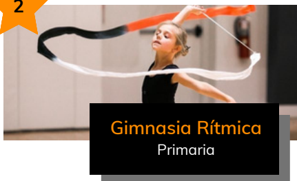
Gimnasia Rítmica Primaria

La gimnasia rítmica es un deporte que incluye tanto el ballet como la gimnasia. Con esta actividad realizas un ejercicio/baile con música, en el que se usan diferentes tipos de aparatos: cinta, pelota, aro o cuerda. Durante las clases los niños/as practican la fuerza, la flexibilidad y el ritmo. Además, la musicalidad, el ritmo y la coordinación juegan un rol importante en las lecciones. Los beneficios de la gimnasia rítmica no son solo físicos. Al ser un deporte que exige seguir cierta planificación por adelantado, el niño/a no puede descuidar lo que está haciendo. Como consecuencia, también se trabaja en la memoria y la atención.