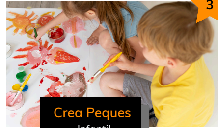
Crea Peques Infantil