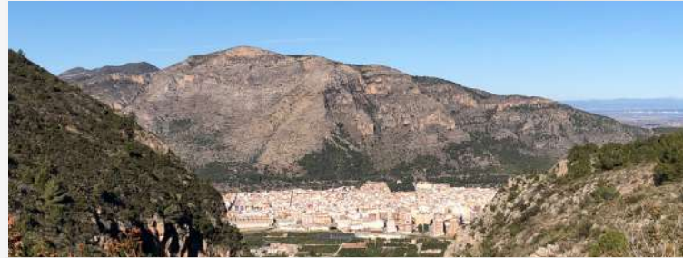
Tavernes de la Valldigna