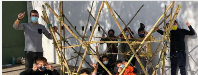
4t Educació Primària 20/21