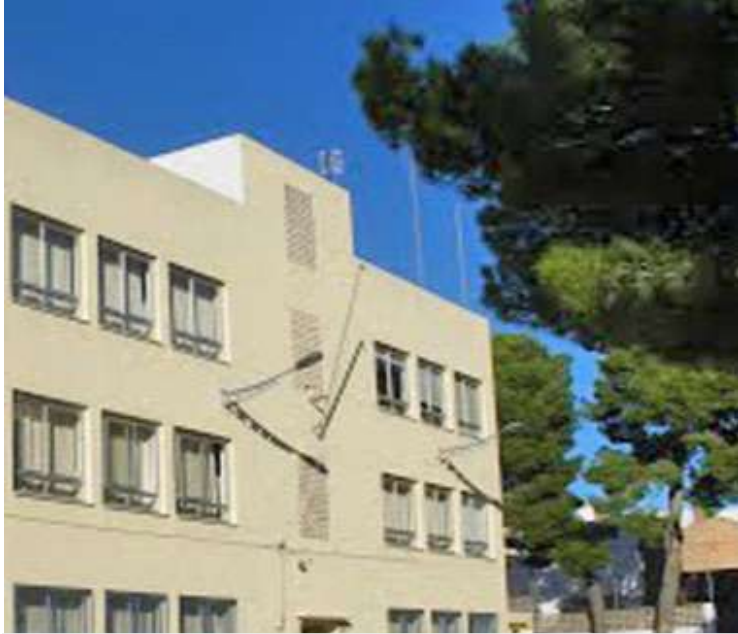
CEIP Sant Miquel