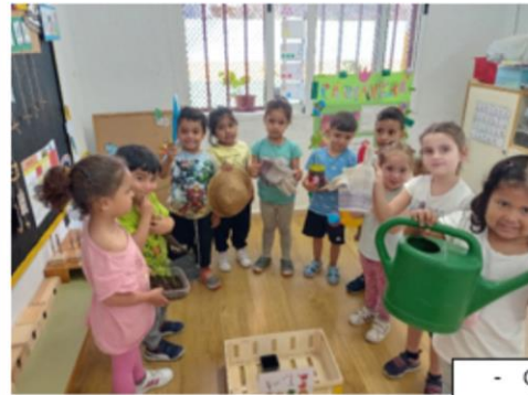
JUQUEM A SER AGRICULTORS/ES