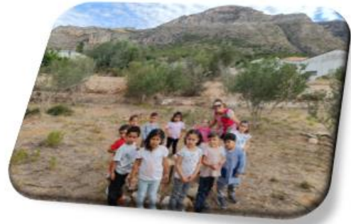
VISITA A L'AULA NATURA