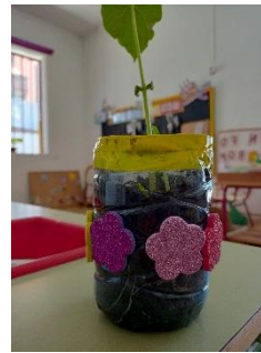
Decorem els tests amb enganxines de gomaeva de purpurina.