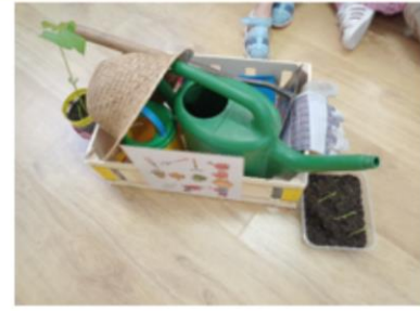
CAIXA D'UTENSILIS D'AGRICULTORS/ES- JARDINER/A