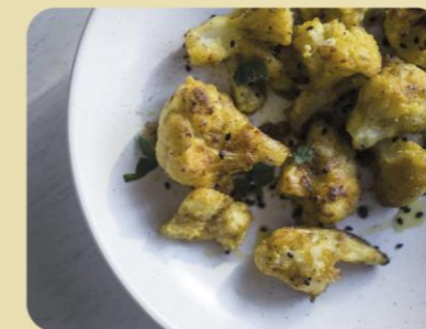
COLIFLOR ESPACIADA CON TOMILLO AL HORNO