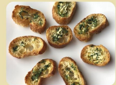
TOSTADITAS DE AJO Y QUESO CON PEREJIL