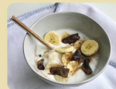
YOGUR CON DÁTILES, PLÁTANO Y CANELA