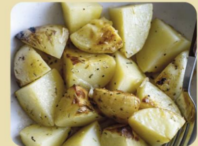
PATATAS AL HORNO CON ROMERO

Utilizar especias en la cocina nos ayuda a mejorar el sabor de nuestros platos además de favorecer la aceptación de alimentos que gustan menos en los más peques. Os animamos a utilizarlas en casa con las siguientes recetas: