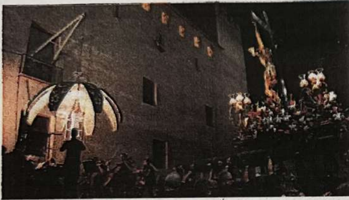
1. "LA CARXOFA".