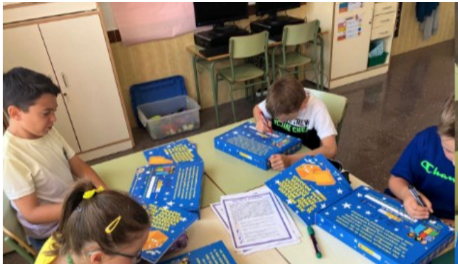
CRA Aràboga. Canet, Cervera i La Jana