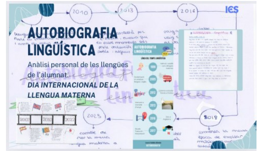
IES Vilaroja d'Almassora