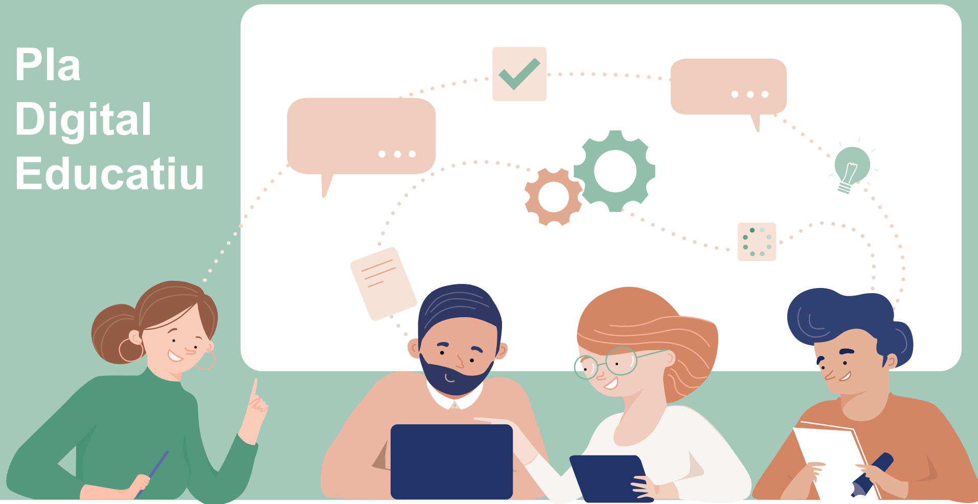
L'equip impulsor del Pla Digital de Centre