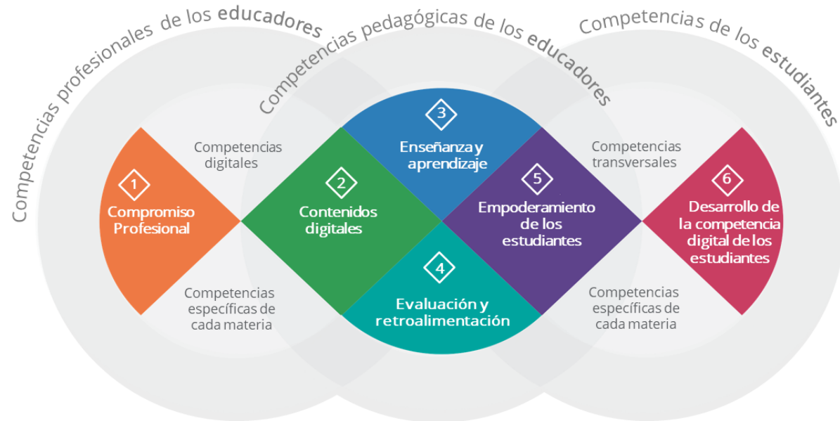
Figura 2: Aproximación conceptual

Para fomentar la adopción del Marco DigCompEdu, los niveles de desempeño utilizan títulos motivadores. Sin embargo, éstos pueden ser asignados a los niveles de competencia utilizados por el Marco Común Europeo de Referencia para las Lenguas (CEFR), que van desde A1 (Novel) hasta C2 (Pionero). En general, se aplican las siguientes caracterizaciones: