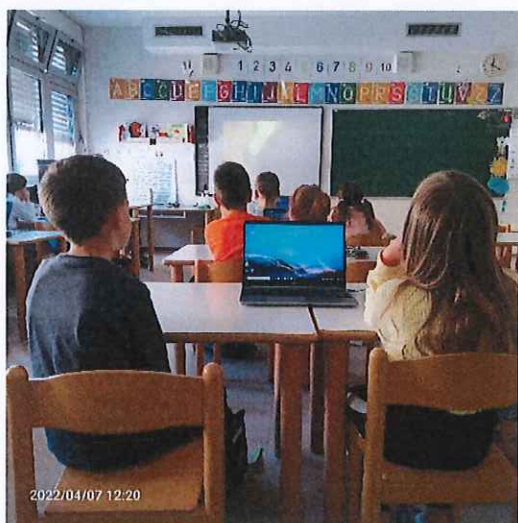
Kahoot per parelles a la classe d'anglès

L'experiència viscuda, sens dubtes, val molt la pena.