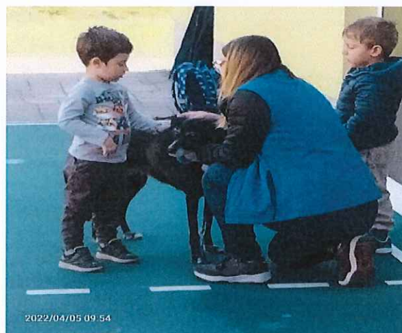
Teràpia amb gossos