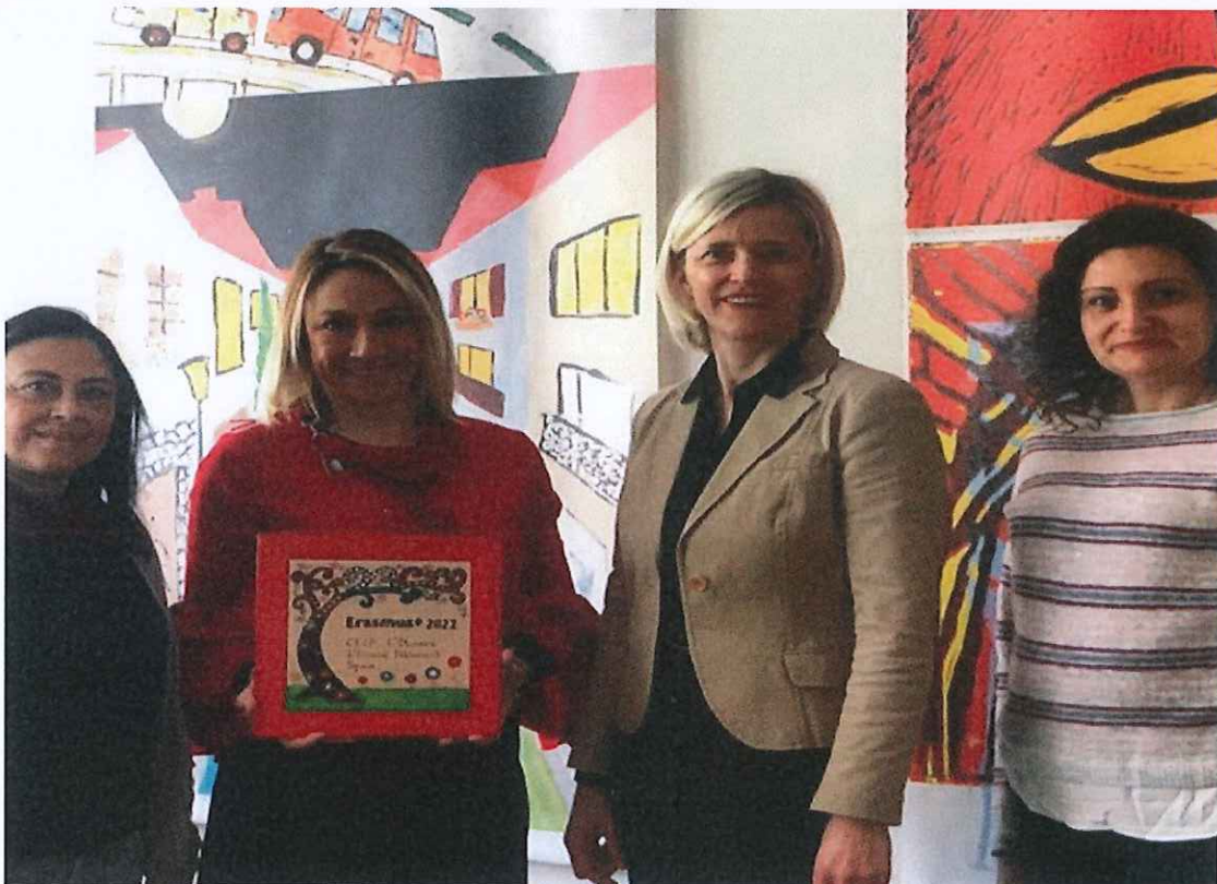
Imatge del moment d'acollida amb la directora del centre i la coordinadora del Projecte Erasmus

Hem de dir, que l'acollida que tinguérem al centre, va ser meravellosa. Ens han preparat unes sessions molt ben organitzades per mostrar-nos el seu sistema educatiu, la seua metodologia i com s'implementa en els diferents nivells educatius.