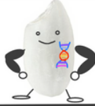
... después de domesticarlo