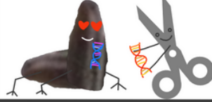
... en una relación con CRISPR-Cas9 ...