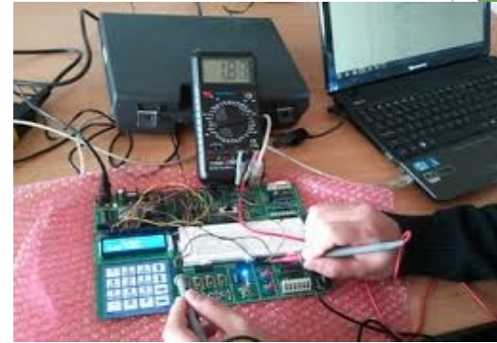
INSTAL·LACIONS DE TELECOMUNICACIONS