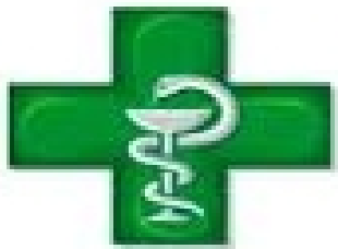
FARMACIA - SANITAT