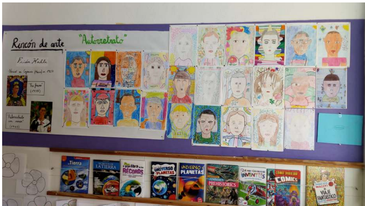
Los alumnos de 4º exponen su autorretrato en el Rincón de Arte.