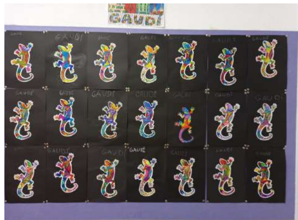
Los alumnos de 3º aprenden sobre el arte de Gaudí.