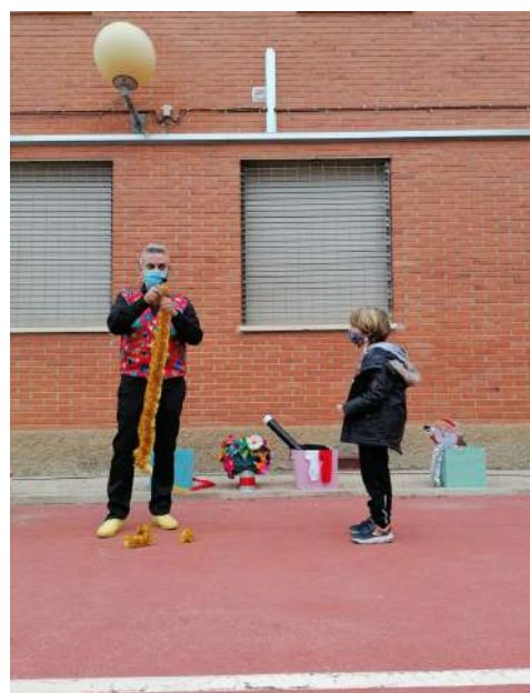
La AMPA organizó la visita a nuestro centro de "EL MAGO".

Nuestro código QR (Accede a nuestro canal de telegram)