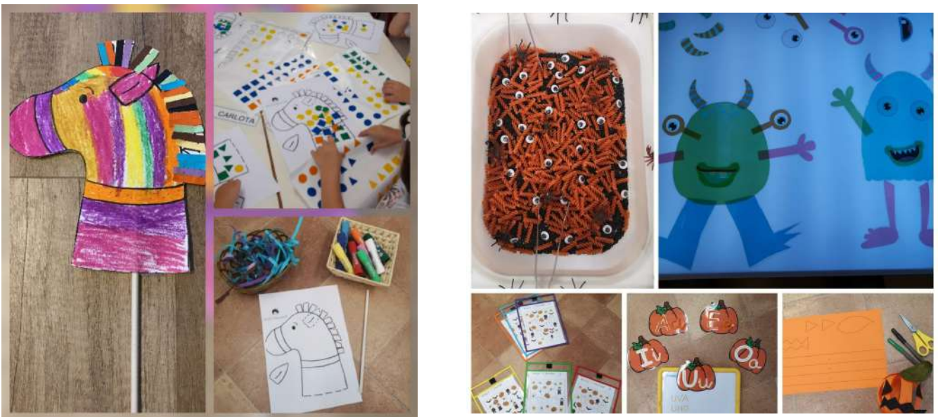
Trabajos y proyectos realizados por los alumnos/as de Educación Infantil.