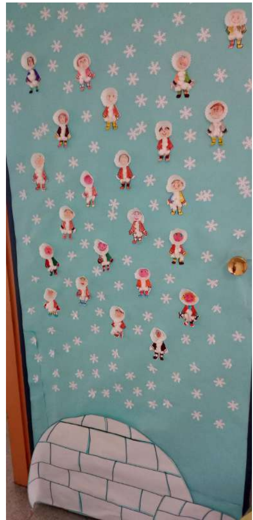
Los alumnos de 1º decoran la puerta del aula sobre el invierno.