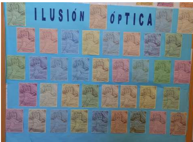
Los alumnos de 3º hicieron este curioso trabajo en clase de Pástica.