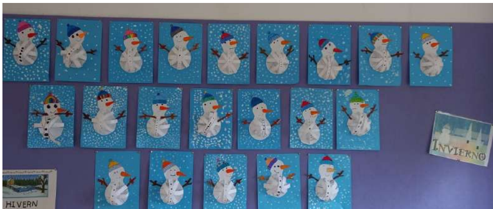
Los alumnos de 3º decoran el aula con motivo de la llegada del invierno.