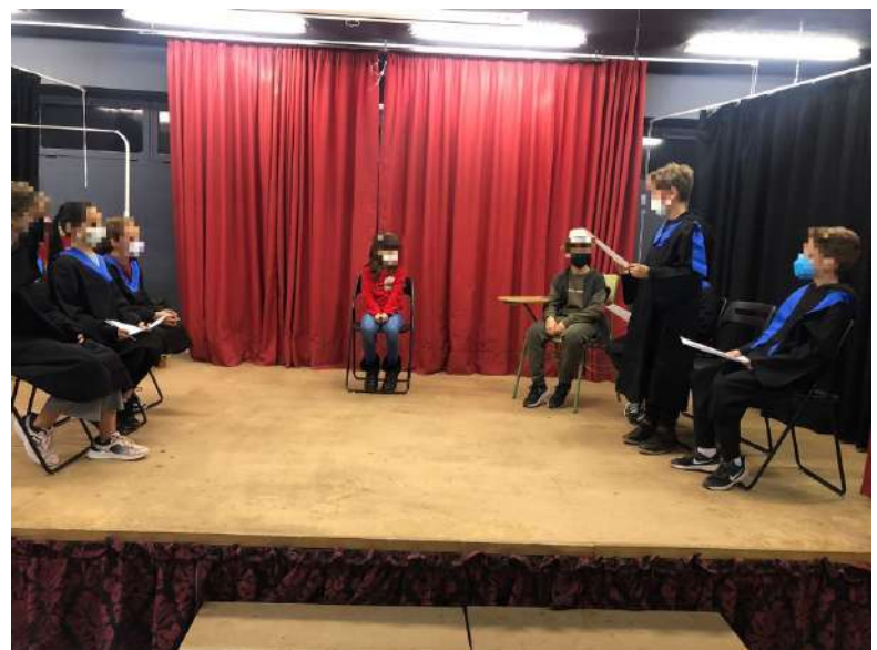
Nociones básicas en 5º y 6º sobre los "ámbitos de aprendizaje" y el teatro.