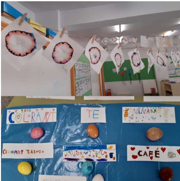
Experimentos en 2º.