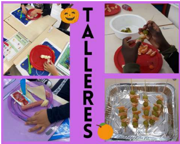
Talleres realizados por los niños/as del Aula Específica.