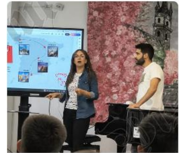
FOTO/VIDEO - Din Alicante, la Colibița și Runcu Salvei: Doi... Doi profesori spanioli se află la Liceul de Muzică „Tudor Jarda”, www.bistriteanul.ro

Posteriormente participamos en un encuentro gastronómico en el que pudimos conocer y degustar diversos platos típicos de la cocina rumana. Durante esta actividad se nos explicó el origen, la elaboración y el significado cultural de algunas recetas tradicionales como son los sarmale (rollitos de arroz y carne especiada envueltos en una hoja de col) y diferentes pască (pasteles de queso dulce; de manzana y canela; de queso con espinacas, etc.) y pan casero tradicional lo cual permitió profundizar en el conocimiento de las costumbres y formas de vida de la región. La gastronomía se convirtió así en un vehículo de intercambio cultural, favoreciendo la convivencia, la comunicación informal entre los participantes y el fortalecimiento de los vínculos creados durante la movilidad.