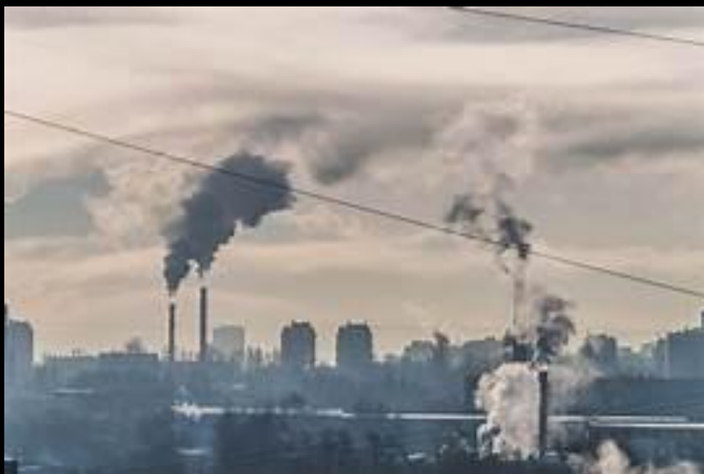
concentración de partículas finas