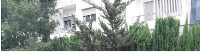
Instalar y mantener un huerto