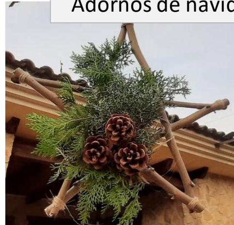
Adornos de navidad