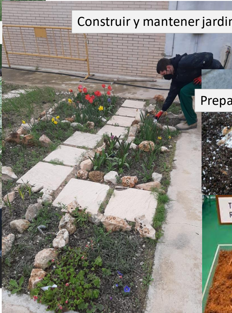
Construir y mantener jardines