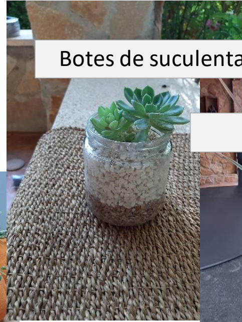
Botes de suculentas