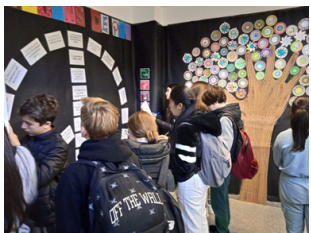
Cohesió TEI dia de la Pau