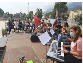
Orquestra Filharmònica i Cor