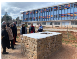
Escaldà de la Pansa