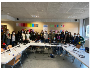
Erasmus + Webradio