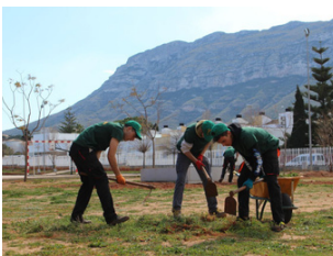
Jardí Cultural i Sostenible