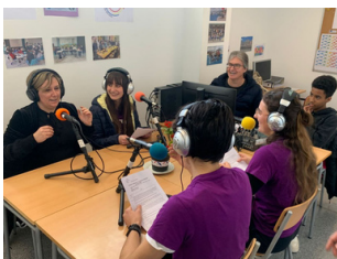
Ràdio Ones del Sorts