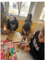
Metodologies actives d'aprenentatge