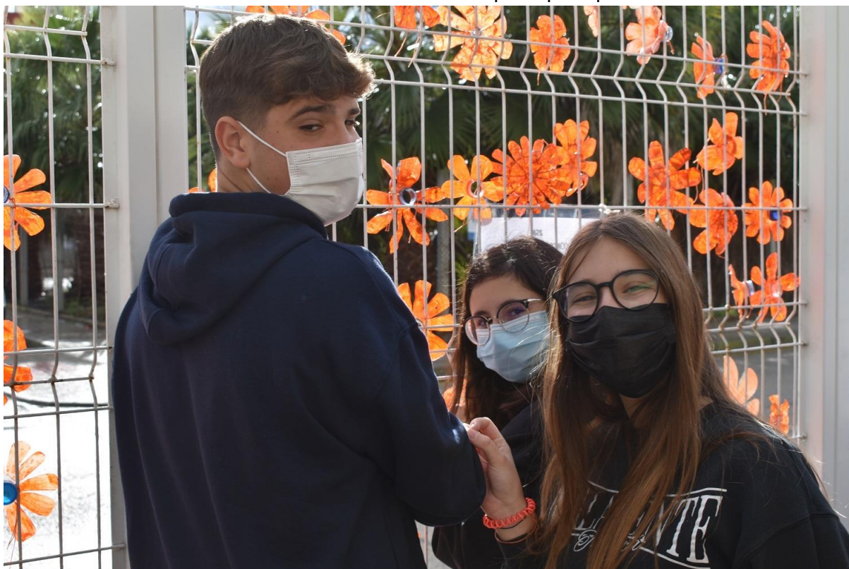
Alumnat de 3r decorant la tanca del centre.