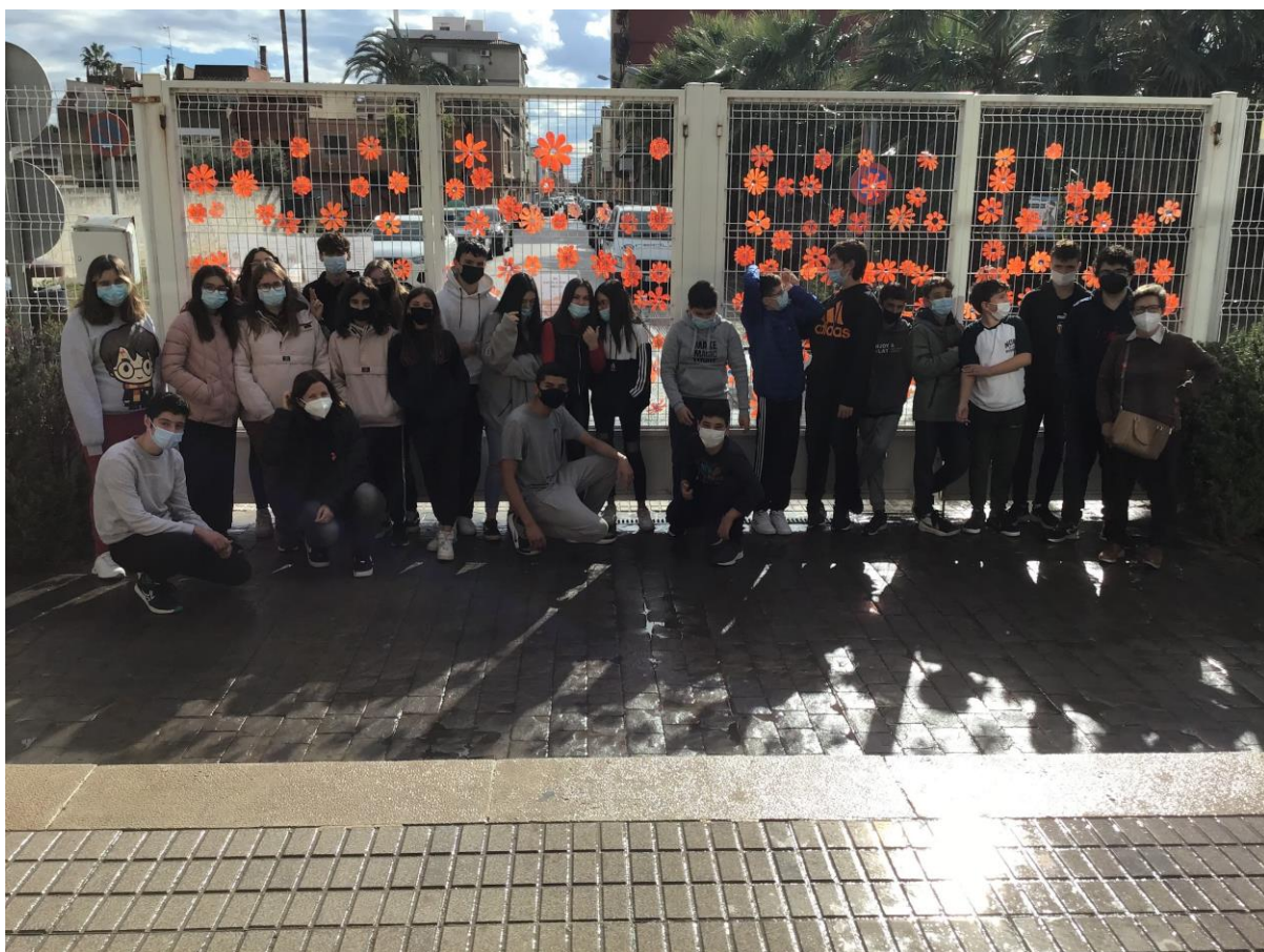
L'alumnat de 2n d'ESO col·locant les seues flors a la porta principal del centre.