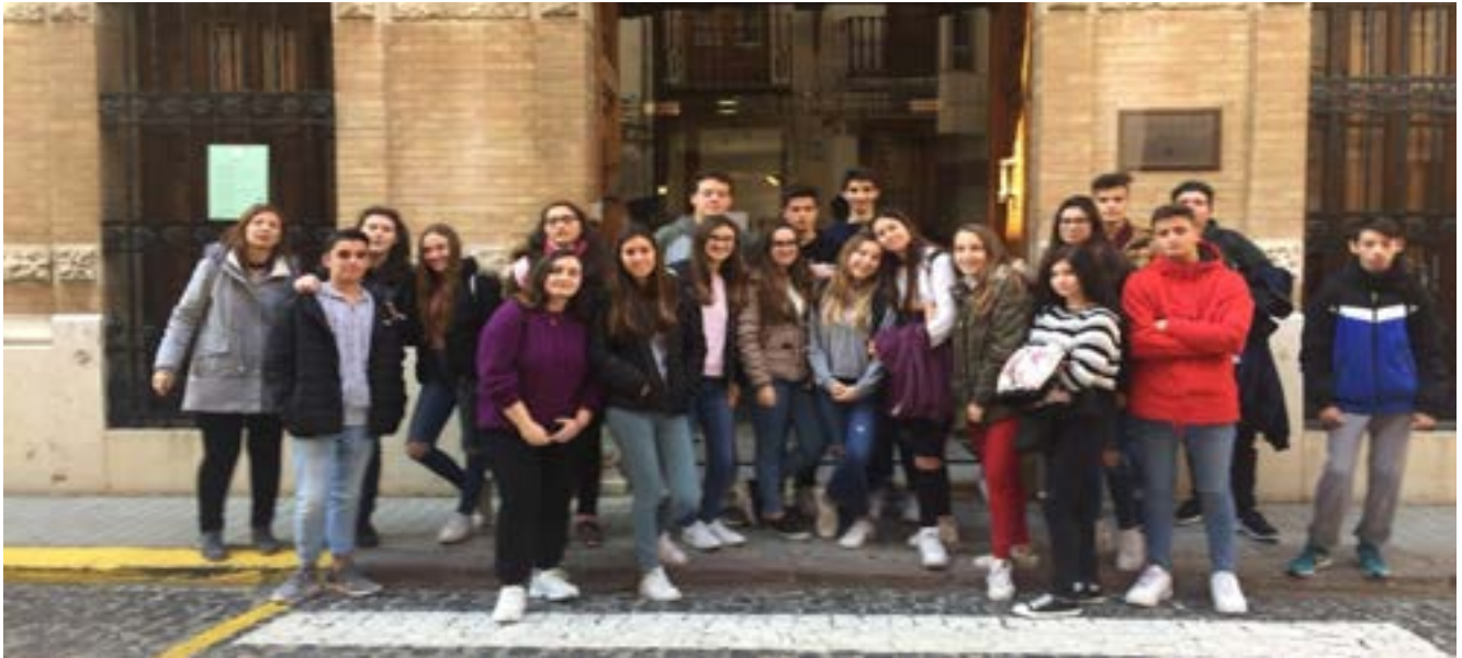
Excursió a Sueca. Davant del Museu Joan Fuster