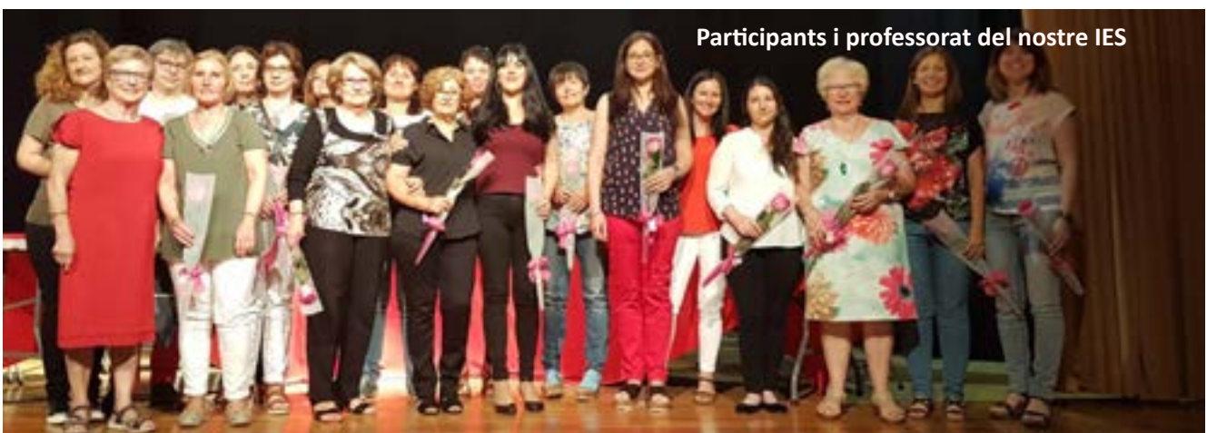
Participants i professorat del nostre IES