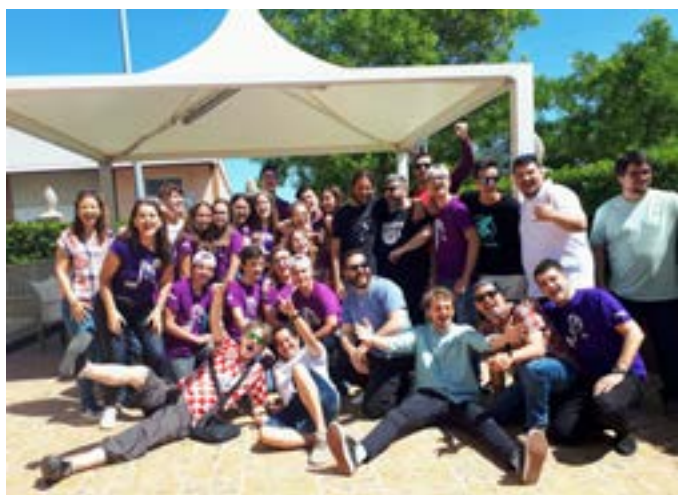
Amb el grup Lilith i Dionis