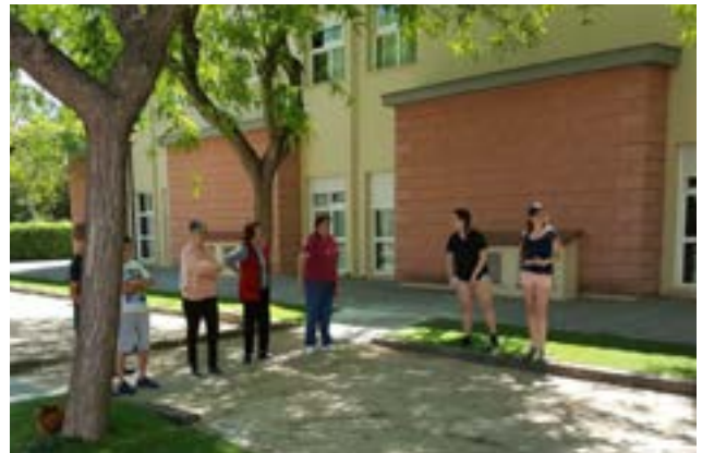
Jugant a la Petanca