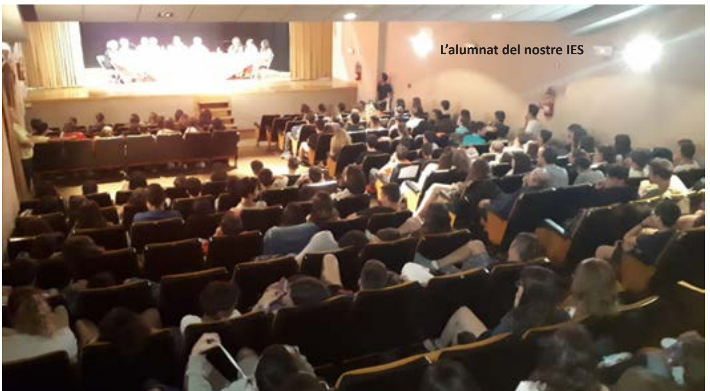
L'alumnat del nostre IES