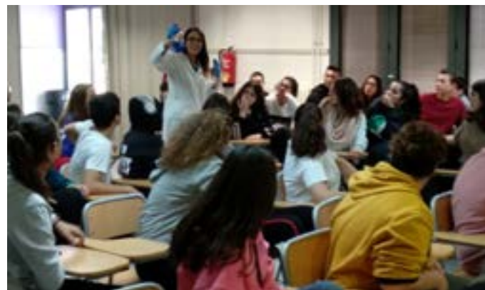
Taller de química

Moltes gràcies pel vostre encomiable esforç! Sabeu que sense vosaltres els tallers no serien possible!