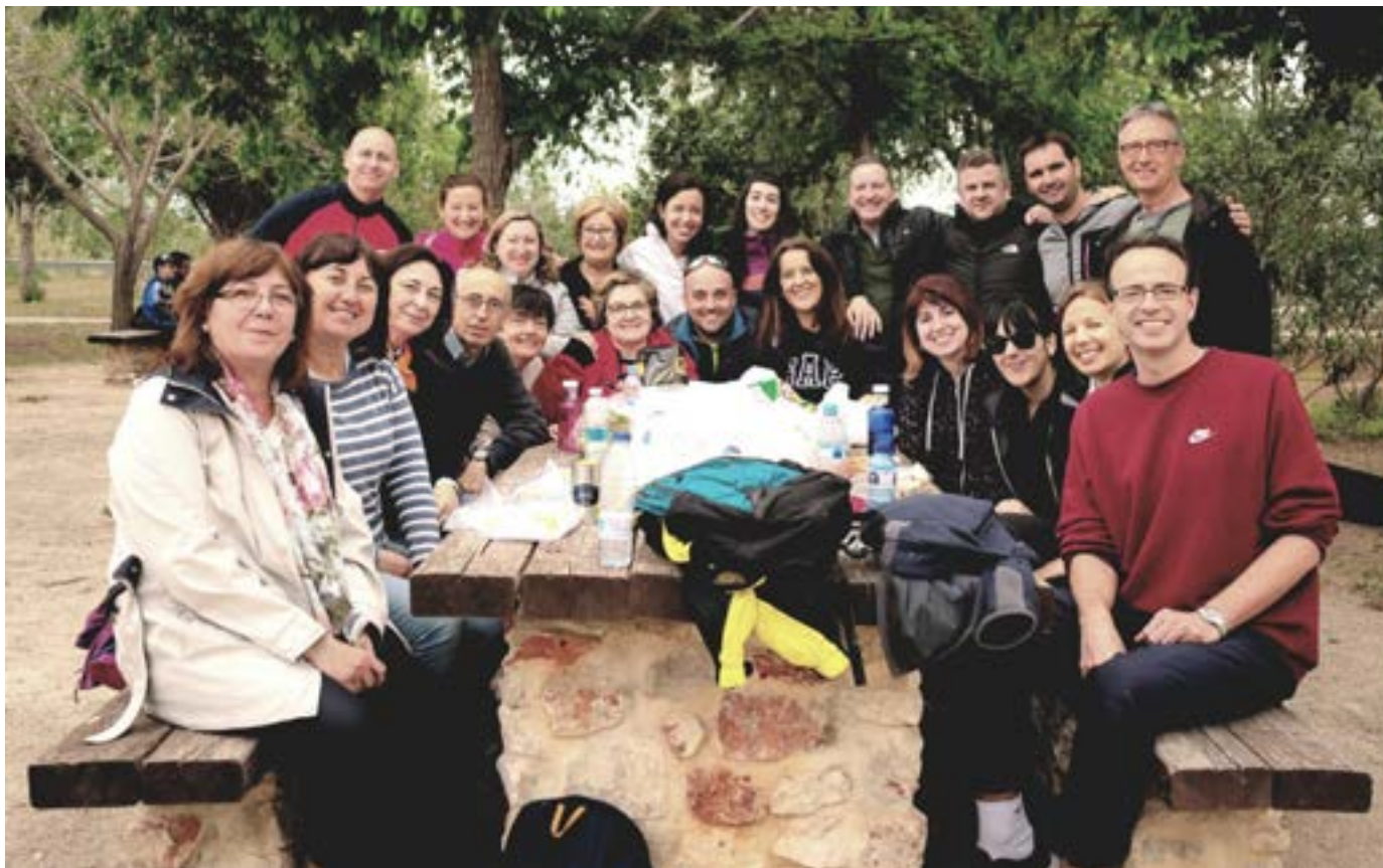
Excursió Setmana Cultural a la Xopera. Algemesí