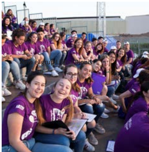
Cor IES SOLLANA

L'ambient de participació i les relacions socials i humanes que s'esdevingueren entre tots els cantaires de tots els centres participants fou realment positiu. El concert començà a les 19'00 hores i el recinte fester de Sueca estava ple de gom a gom. L'experiència fou inoblidable i l'ambient que es respirava entre tots nosaltres era genial, de germanor i de solidaritat. Però el més important de tot és que ens ho passarem d'allò més bé i ens divertírem moltíssim fent música i fent gaudir al públic. I tot açò per una bona causa solidària: l'ajuda a la pobresa infantil.