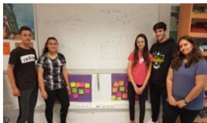
Taller de química