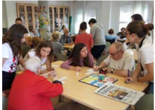
Jugant a jocs de taula