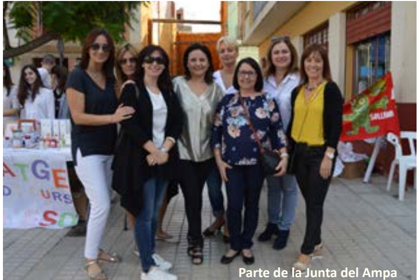
Parte de la Junta del Ampa

Aunque nuestro slogan lo dice (“AMPA somos todos”) hoy me permito escribir en primera persona (y en castellano, que es mi lengua materna) como presidenta.