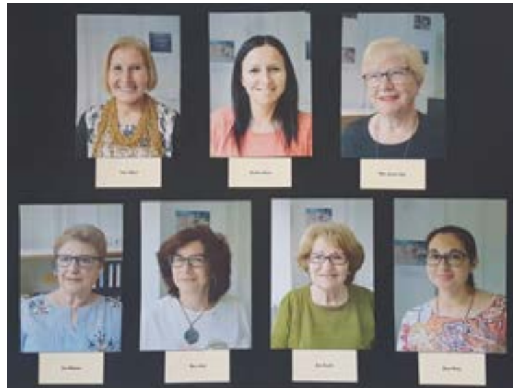
Participants de la taula redona

En definitiva, una jornada completa, intergeneracional, on el nostre alumnat pogué escoltar de