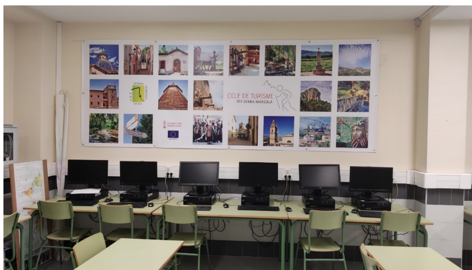
Foto 8, 9 i 10. Aules temàtiques.