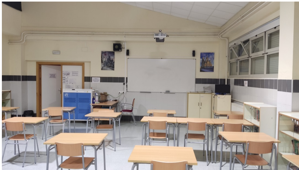
Foto 24. Vista frontal de la Biblioteca.