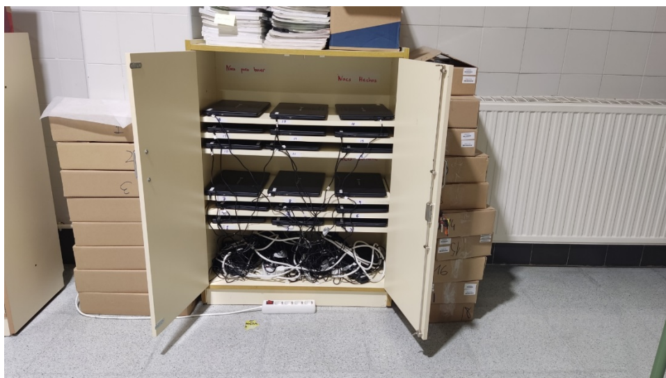
Foto 25. Armari fixe de càrrega i custòdia de portàtils amb 18 dispositius.