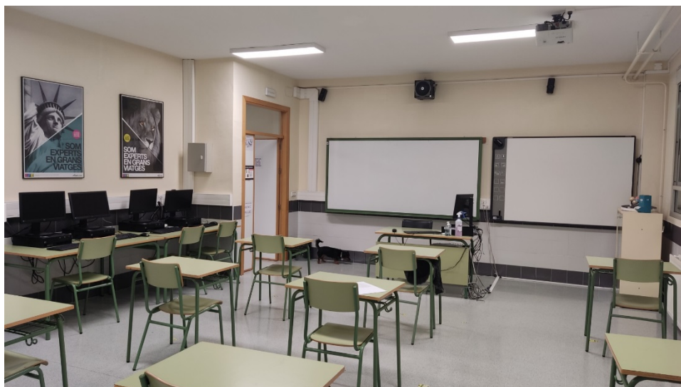
Foto 4. Vista frontal.

A banda es disposa també d'una pissarra veleda blanca per a escriptura amb retoladors i marc d'alumini, situada paral·lelament a la pissarra digital. També comptem amb un sistema d'àudio 2 en 1 distribuït amb un subwoofer en el centre a la part superior de les pissarres i dos altaveus als costats. Aquesta aula també disposa d'una tela verda chroma desplegable al final de l'aula per a poder realitzar vídeos utilitzant la tècnica del chroma key.