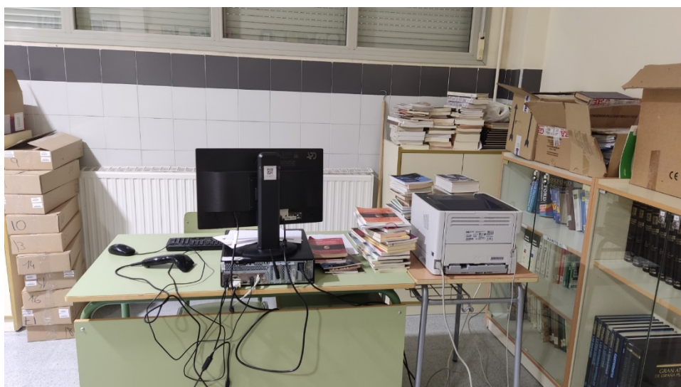
Foto 27. Ordinador de sobretaula amb lector de codis de barres dedicat a la gestió de la Biblioteca.

Com es pot observar en els anterior punts comentats, el nostre centre disposa de molts espais aprofitables i allò que no tenim es veu compensat pel suport de l'ajuntament de Muro reflectit, per exemple, en la cessió de les instal·lacions municipals com potser el Centre Polivalent quan necessitem d'una sala amb més capacitat.