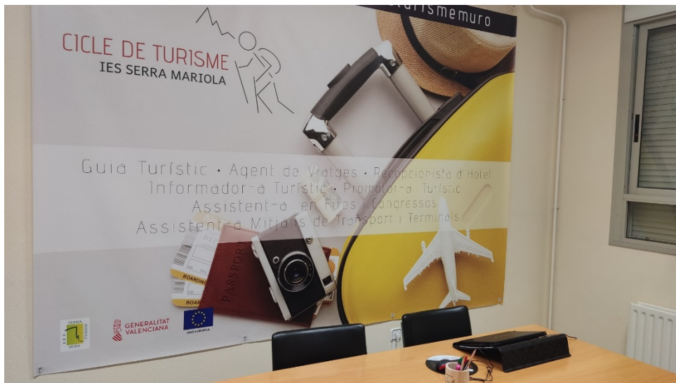
Foto 21. Taula i fons temàtic de la TV del Cicle de Turisme.