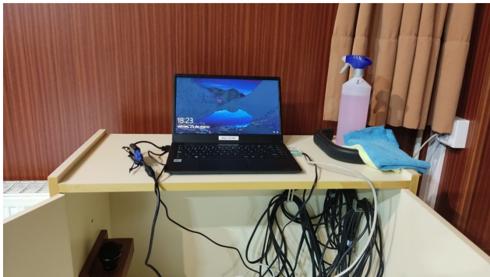
Foto 16. Portàtil habilitat a la Sala d'Actes per a les projeccions.