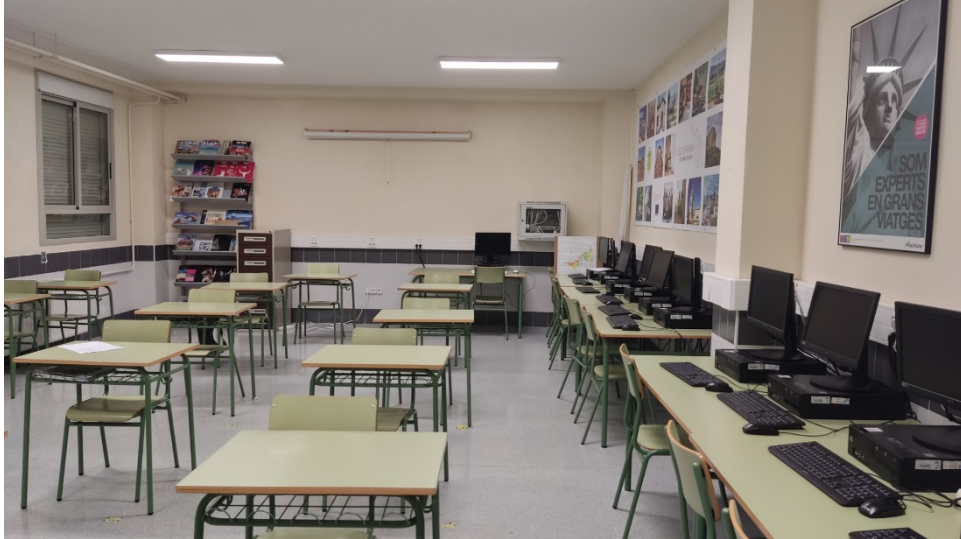
Foto 6. Vista trasera amb l'equipament informàtic.