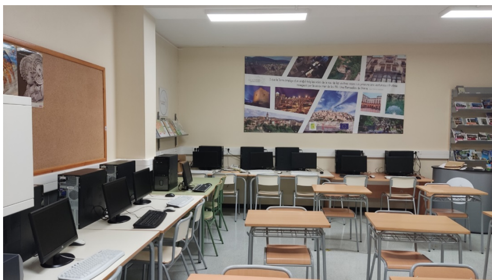
Foto 3. Equipament informàtic de l'aula.