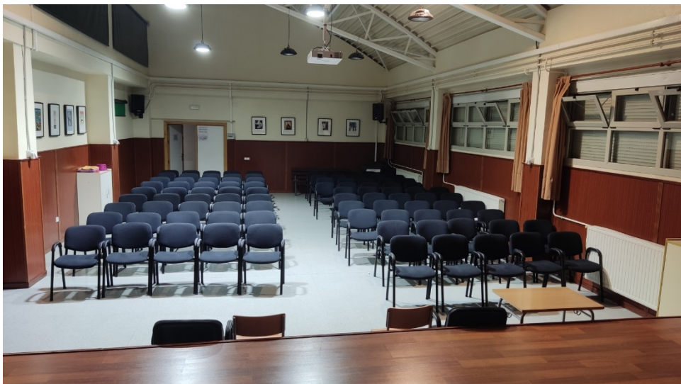
Foto 13. Vista des de l'escenari.