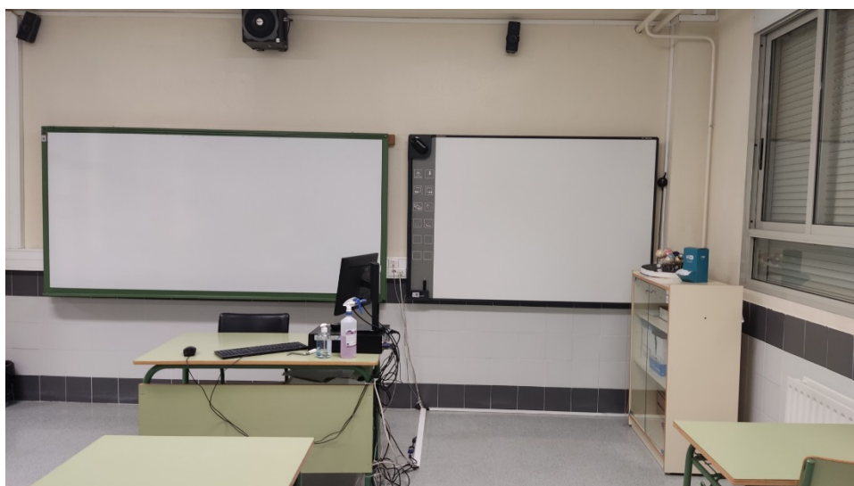
Foto 5. Pissarra digital i pissarra veleda blanca.