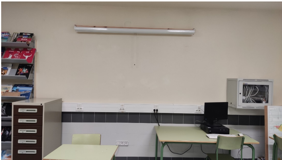
Foto 7. Tela verda chroma desplegable.