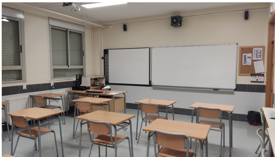
Foto 1. Vista frontal.

A banda es disposa també d'una pissarra veleda blanca per a escriptura amb retoladors i marc d'alumini, situada paral·lelament a la pissarra digital. També comptem amb un sistema d'àudio 2 en 1 distribuït amb un subwoofer en el centre a la part superior de les pissarres i dos altaveus als costats.