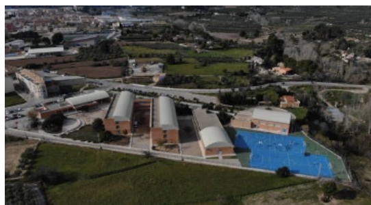
IES SERRA MARIOLA — MURO D'ALCOI—