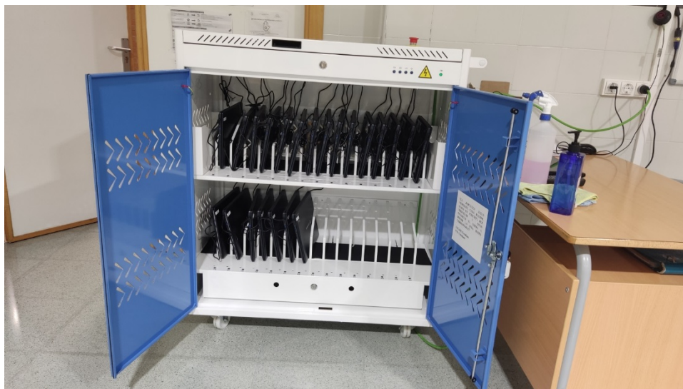
Foto 26. Armari mòbil de càrrega i custòdia de portàtils amb 22 dispositius.