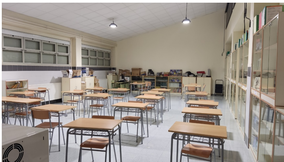
Foto 23. Vista general de la Biblioteca des de la porta d'entrada.

Per últim, nomenarem la Biblioteca del Centre, ja que actualment està utilitzant-se com a sala d'usos múltiples degut a l'equipament que hi ha disponible en aquesta: portàtil i projector multimèdia, equip d'àudio 2 en 1, ordinador de sobretaula per al préstec dels llibres, armari fixe amb 18 portàtils i carro de càrrega de portàtils mòbil amb 22 portàtils per al seu ús en qualsevol aula.