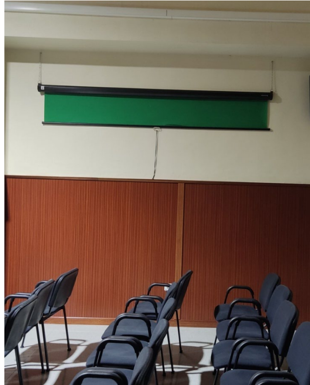
Foto 14 i 15. Equipament: Equip de so i control de la megafonia i tela verda chroma desplegable.