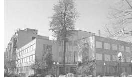
IES SAN VICENTE FERRER DE VALÈNCIA