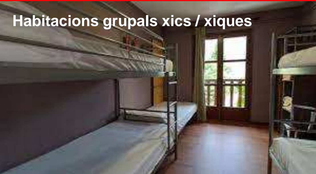
Habitacions grupals xics / xiques