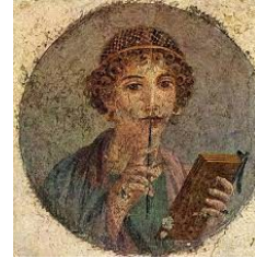
Figura 1: Sapo de Lesbos

Cristina Lliso Blesa c.llisoblesa@edu.gva.es