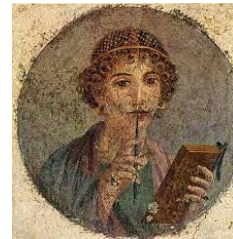
Figura 1: Safo de Lesbos