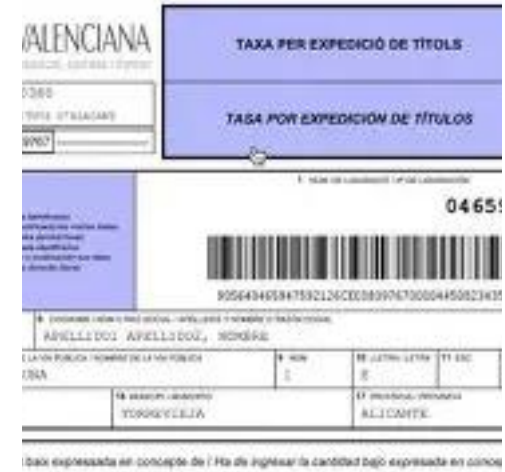
Tasas Título Bachillerato/ Taxes Títol Batxillerat

DOCUMENTACIÓN A ENTREGAR/ DOCUMENTACIÓN A ENTREGAR