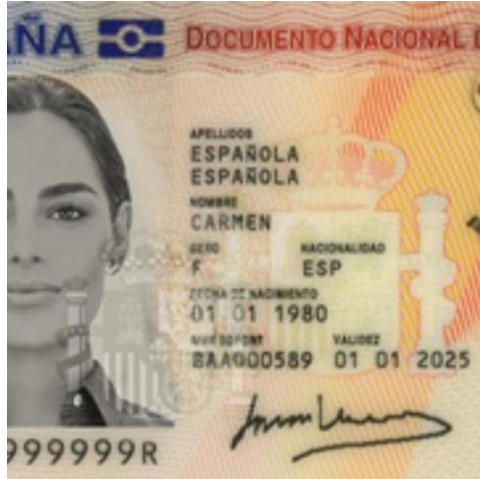
Fotocopia DNI-NIE/ Fotocòpia DNI-NIE