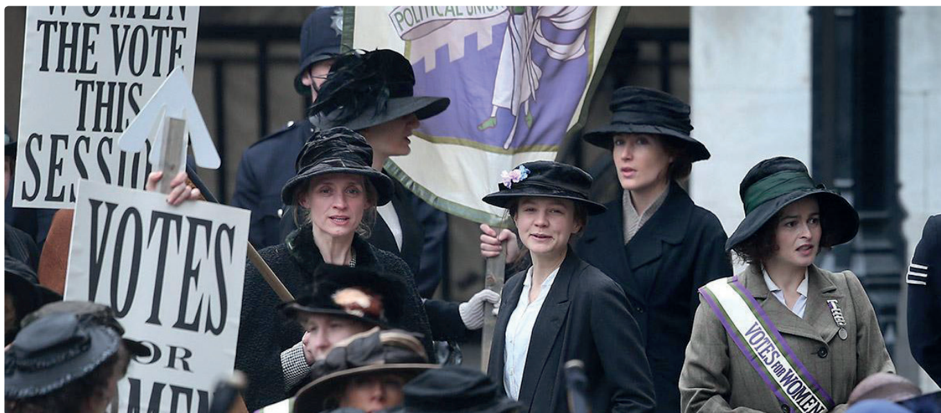
Fotograma de Suffragistas (2015), amb les protagonistes al centre.