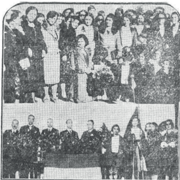
En Baracaldo se ha celebrado un importante acto de propaganda republicana organizado por el partido radical. En la fotografía superior, la señorita Clara Campoamor rodeada de un grupo de mujeres que la rinden homenaje por su calurosa defensa del voto femenino. En la fotografía inferior, la Mesa organizadora del acto.

Fragment d'hemeroteca de la militància de Clara Campoamor. Heraldo de Madrid , 7/12/1931.