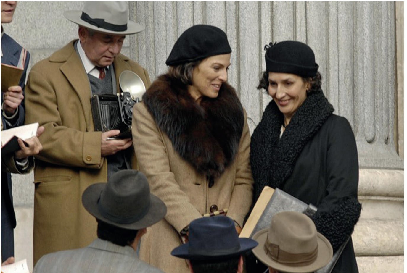
Victoria Kent i Clara Campoamor representades a la pel·lícula de Laura Mañá. Foren dues de les tres dones diputades de la II República i van defensar posicionaments contraris sobre el sufragi femení.