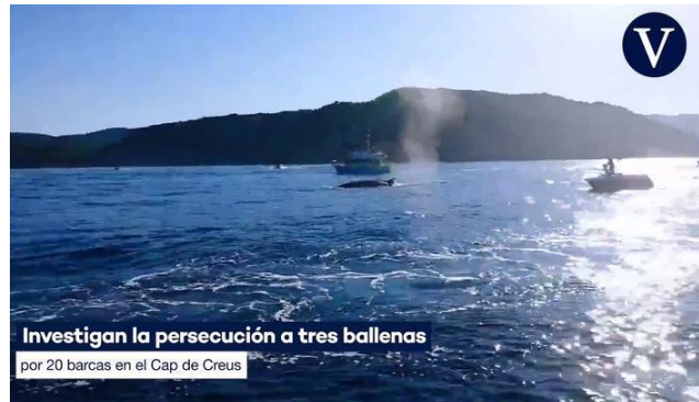
Investiguen la persecució a tres balenes por 20 barcas en el Cap de Creus

Diverses persones de conservació de la natura, han denunciat aquesta acció per dur a terme maniobres prohibides que poden perjudicar els animals, tant generant-los estrès, tenint en compte que són animals acústics, és a dir, tenen molta oïda.