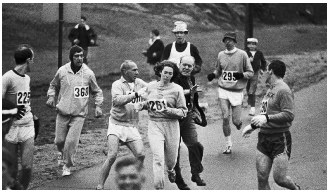
(Primera dona que corre una maratón amb dorsal)