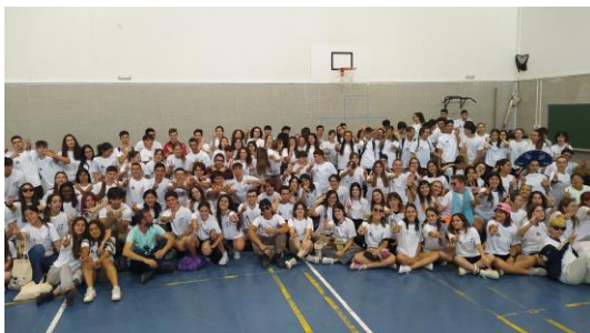
Alumn@s participantes en el proyecto