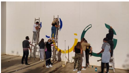
Alumn@s participantes en el proyecto