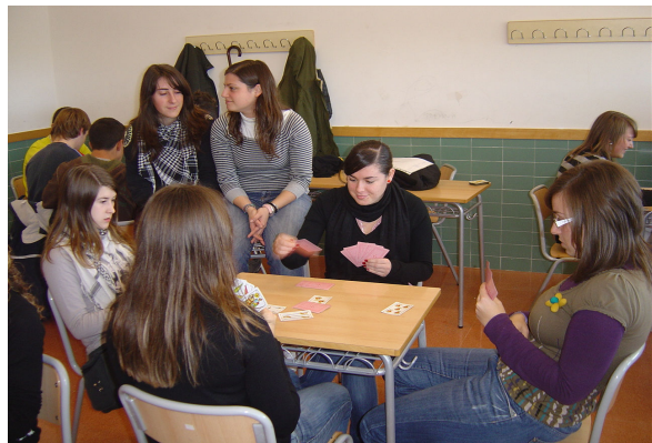
Concurs de guinyot