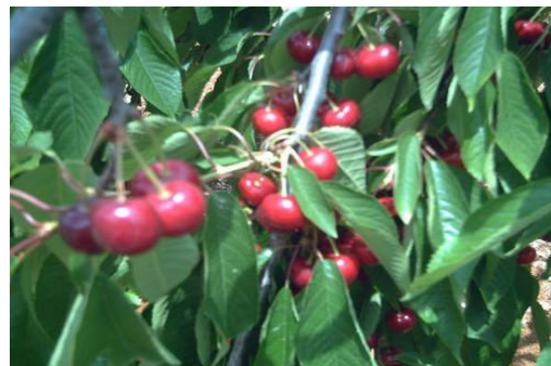
Cireres de La Salzedella

Aquesta fira es podria tornar a repetir,perquè, per a ser el primer any,hi havia molta gent i va agradar molt.