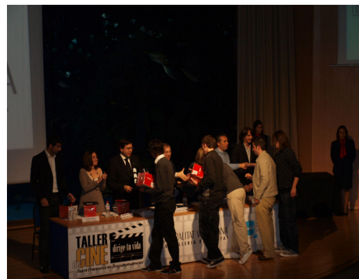
Jurat entregant els premis als guanyadors.