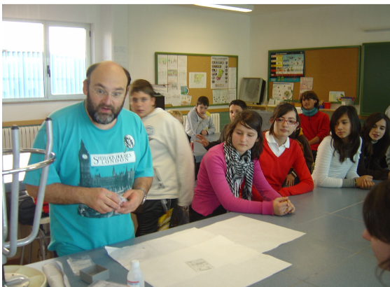
Activitats al laboratori

Ací es troben algunes de les fotografies d'aquell dia tan especial: