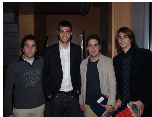
Alumnes amb Raül Albiol, jugador del VCF.