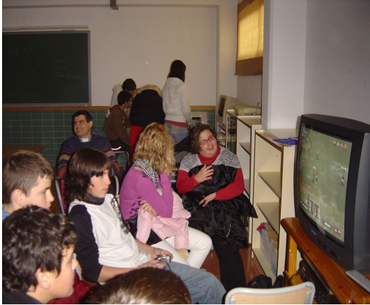
Campionat amb la Play Station