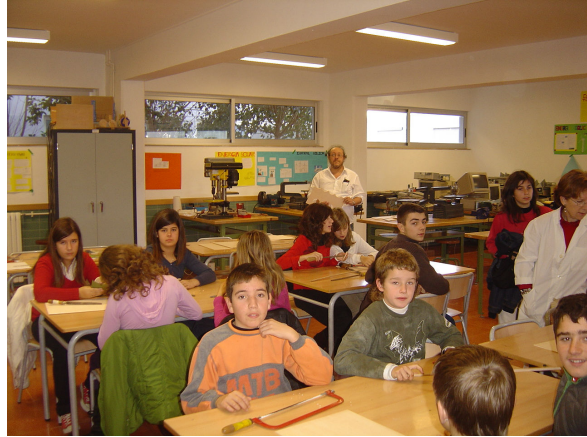
Taller de Trompas i Pirindolas