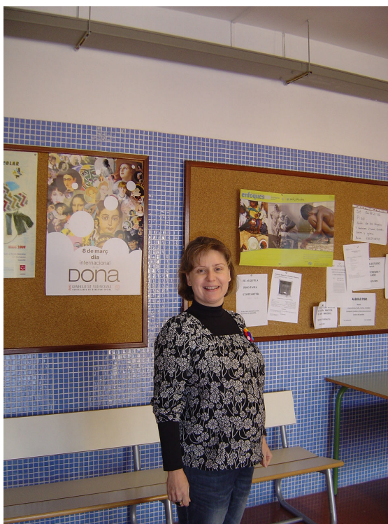
Feli a l'entrada de l'institut

Tocava la guitarra i des que estic embrassada, no la puc tocar