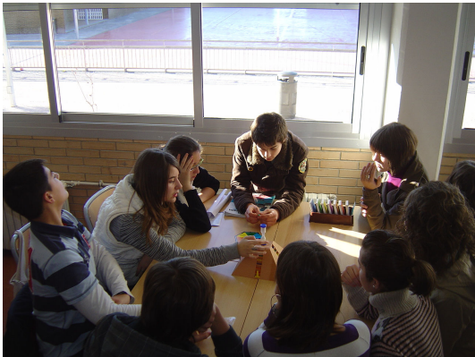
Jocs de taula