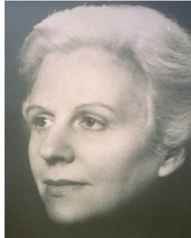
L'escriptora Mercè Rodoreda.

Perquè es commemora el centenari del naixement d' aquesta escriptora. Els objectius d'aquesta celebració són