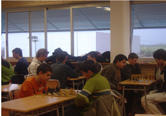
Els nostres companys jugant als clàssics jocs de taula.