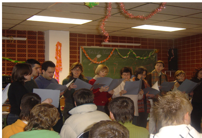
Els professorat del nostre centre cantant. Per què va ploure tant abans d'anar-nos-en aquell dia? No, s'ha de dir que ho van fer molt bé.