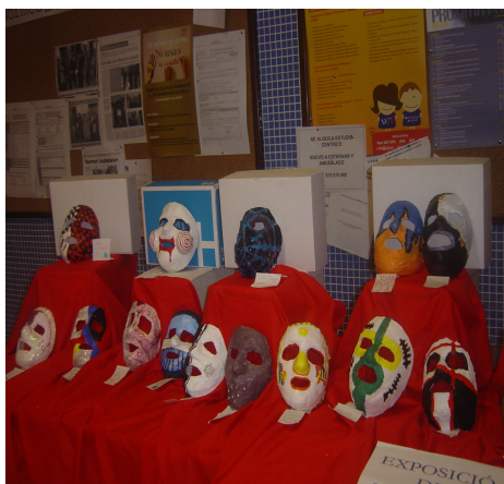
Exposició de màscares de 2n d' ESO.

Ací trobem algunes de les fotografies dels moments més divertits d'aquest dia: