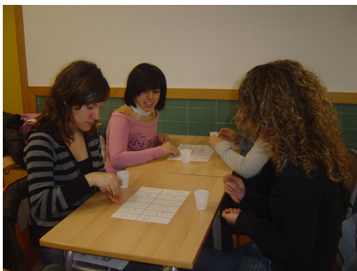
El joc del fesol.