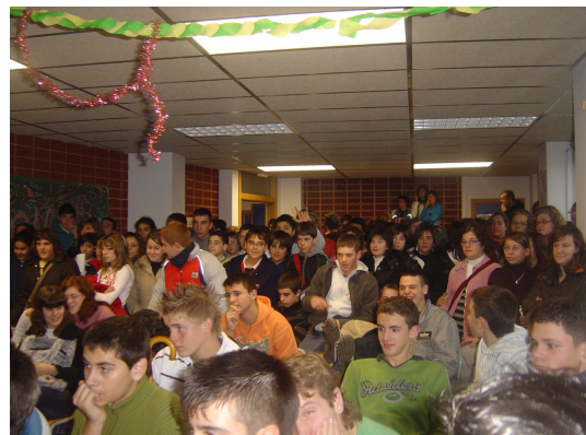
L'alumnat esperant el fantàstic Concert de Nadal.