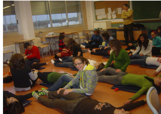
Qui no vol un bon massatge?