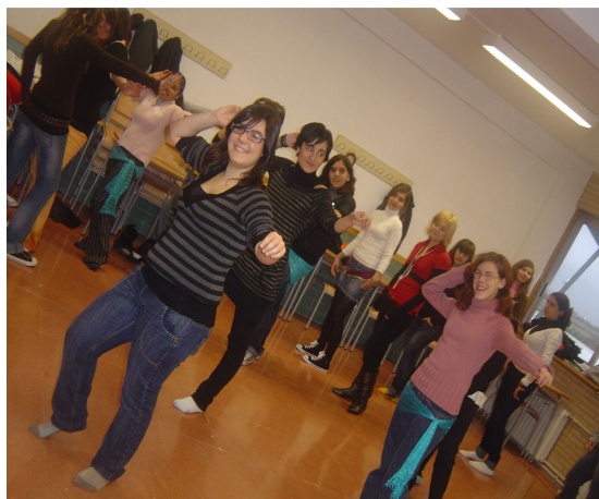
Totes ballant la dansa del ventre.