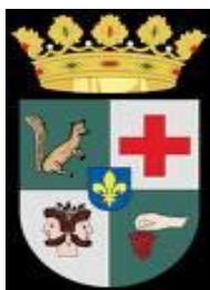
Escut de La Jana

Dissabte al matí es va fer la "IV Trobada de Puntaires