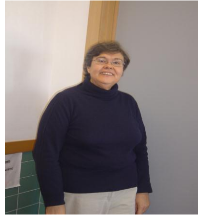
Tere a la sala de professors després de l'entrevista.

Perquè ser director/a suposa assumir una tasca molt feixuga, ja que totes les persones de l'institut (alumnat, professorat i personal no docent), són responsabilitat del director/a, que té el deure de procurar que tot funcione bé. I això socarra a qualsevol.