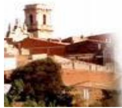
Poble de La Jana