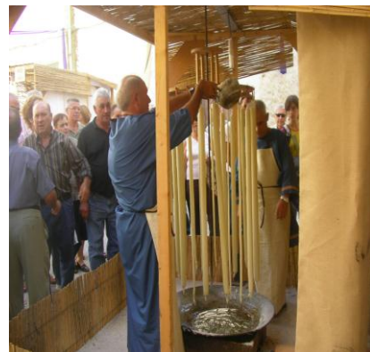
Com es feien els ciris antigament

Va haver-hi molta participació per part de tota la gent.