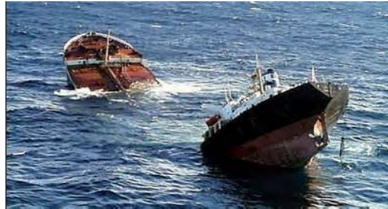
Un dels tants vaixells petroliers que s'enfonsen en les nostres mars.

A més a més, la contaminació de les mars a causa del petroli perjudica les espècies marines