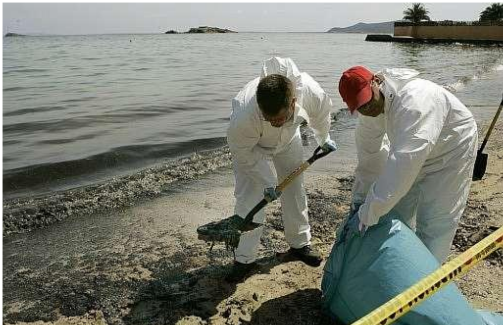
Dos voluntaris col.laborant en la neteja de les platges contaminades a causa del petroli.

Només així es podran evitar molts accidents catastròfics com ara el del Prestige .