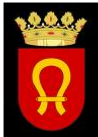
Escut de Traiguera