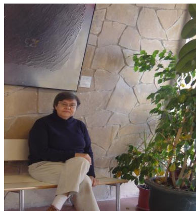
Tere a l'entrada de l'institut.

Anècdotes gracioses en tinc moltes, com tots. I en tinc una de molt desagradable que la recorde perquè la vaig considerar una tremenda injustícia que, a més, va fer que em denegaren la beca per al curs següent. Una professora em va deixar per a setembre la meitat de la seua assignatura, tot i que la mitjana era de 5.5, perquè li vaig dir que la classe havíem fet l'exercici malament perquè ella no l'havia explicat. Es va enfadar tant que em va suspendre. "increíble pero cierto"