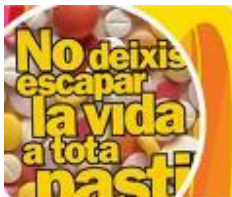
Fotografia d'una campanya antidrogues.

L' eina més eficaç contra les drogues ets tu.