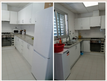
Aula-taller de apoyo domiciliario