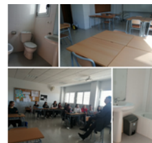
Aula-taller de apoyo domiciliario