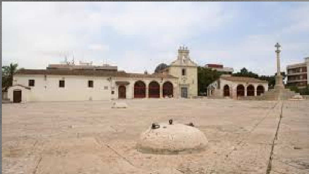
Plaça de Burjassot

LA CLAU QUE OBRI TOTS ELS PANYS de Vicent Andrés Estellés