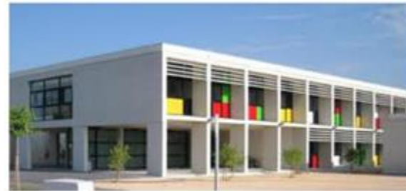
IES JAUME I (Sagunt)